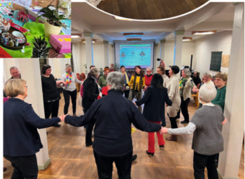
links oben: Taiwanesisches Essen nach der WGT-Feier in Cumbach rechts oben: Vorbereitung der WGT-Feier bei der Christenlehre in Cumbach links unten: Zentraler Familiengottesdienst zum WGT in Cumbach rechts mittig: WGT-Dekoration im Gemeindesaal Rudolstadt rechts unten: WGT-Tanz in Rudolstadt