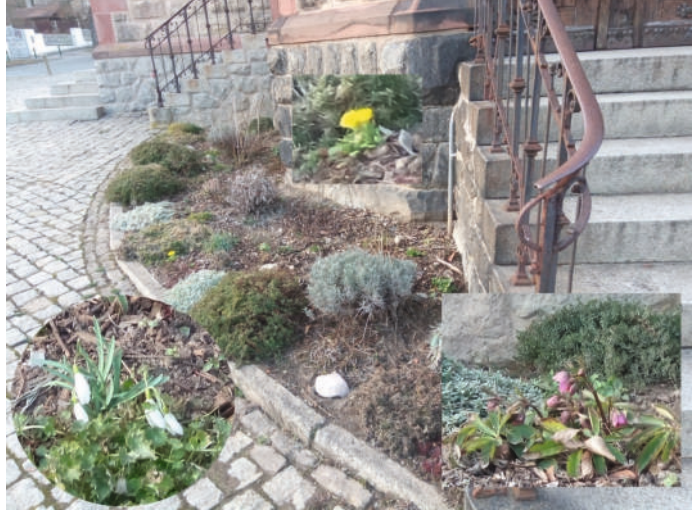
Blumenrabatte an der Lutherkirche mit Detailaufnahmen von Frühjahrsblühern

Wer nicht nur achtlos an der Lutherkirche vorbeigeht, dem wird aufgefallen sein, dass sich hin und wieder etwas getan hat – mal auf dem Vorplatz und mal im Gelände hinterm Zaun. Bei drei Sonnabend-Einsätzen wurden im Vorjahr der Rasen gemäht, die Hecke geschnitten und die Müllhaufen beseitigt, die hier auf wundersame Weise immer wieder nachgewachsen waren. Das Gebüsch entlang der Grundstücksgrenze zum Pfarrhaus wurde stark gelichtet und schließlich wurden auch die Gräser und Kräuter in den Fugen zwischen den Pflastersteinen beseitigt. Aber die Wirkung dieser Einsätze war nur von begrenzter Dauer. Für eine professionelle Pflege des Geländes fehlt das Geld, und mehr als drei Wochenend-Einsätze pro Jahr sind selbst vom harten Kern der freiwilligen Helfer kaum zu stemmen. Auch das Gelände um die Stadtkirche und um das Gemeindehaus braucht dringend fürsorglichere Pflege. Aus dieser Notlage entstand die Idee, dass eine schon seit Jahren funktionierende Form der persönlichen Patenschaft für ein kleines abgegrenztes Areal auf andere Flächen an der Lutherkirche oder an der Stadtkirche angewandt werden könnte. Seit längerer Zeit kümmert sich eine Familie um eine Blumenrabatte an der Lutherkirche, die rechts vom Haupteingang hin zur Caspar-Schulte-Straße liegt. Vom zeitigen Frühjahr bis zum Spätherbst blüht es dort – selbst in