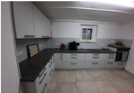
Blick auf einen Teil der neuen Küche in Cumbach

Nachdem die Kirchengemeinde Cumbach in den letzten Jahren das Dach und das Fundament ihres Gemeindehauses sanieren und auch die Eingangstür erneuern ließ, waren nunmehr der Küchenraum und die Toiletten Gegenstand jüngster Baumaßnahmen. Da-