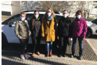
Das Team des ABW in Rudolstadt

Auch in der außergewöhnlichen Zeit der Corona-Pandemie, die allen ein Höchstmaß an Flexibilität, Kraft, Einfühlungsvermögen und Optimismus abverlangt, stehen für uns die Klienten als Menschen im Vordergrund.