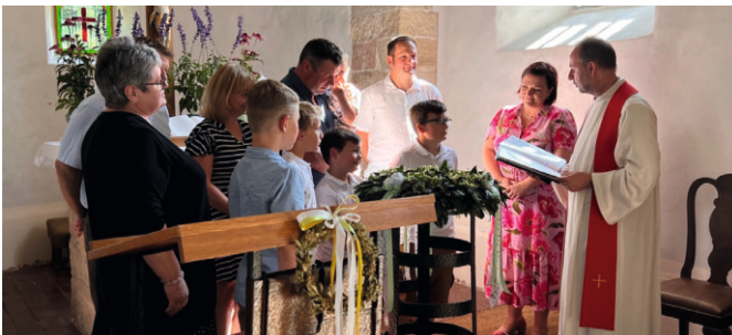
Taufgesellschaft in der Kirche Pflanzwirbach

Man gibt sich wieder vor Gott und seiner Gemeinde das „Ja-Wort“! Zahlreiche Trauungen in unseren Kirchen, aber auch an anderen exponierten schönen Orten, bestimmten die zurückliegende Sommerzeit. Viele Trauungen waren zugleich mit Taufen verbunden. Auch für das kommende Jahr gibt es bereits zahlreiche Anmeldungen. Eine Vormerkung für Interessierte im Pfarramt empfiehlt sich, damit es nicht zu Terminüberschneidungen kommt.