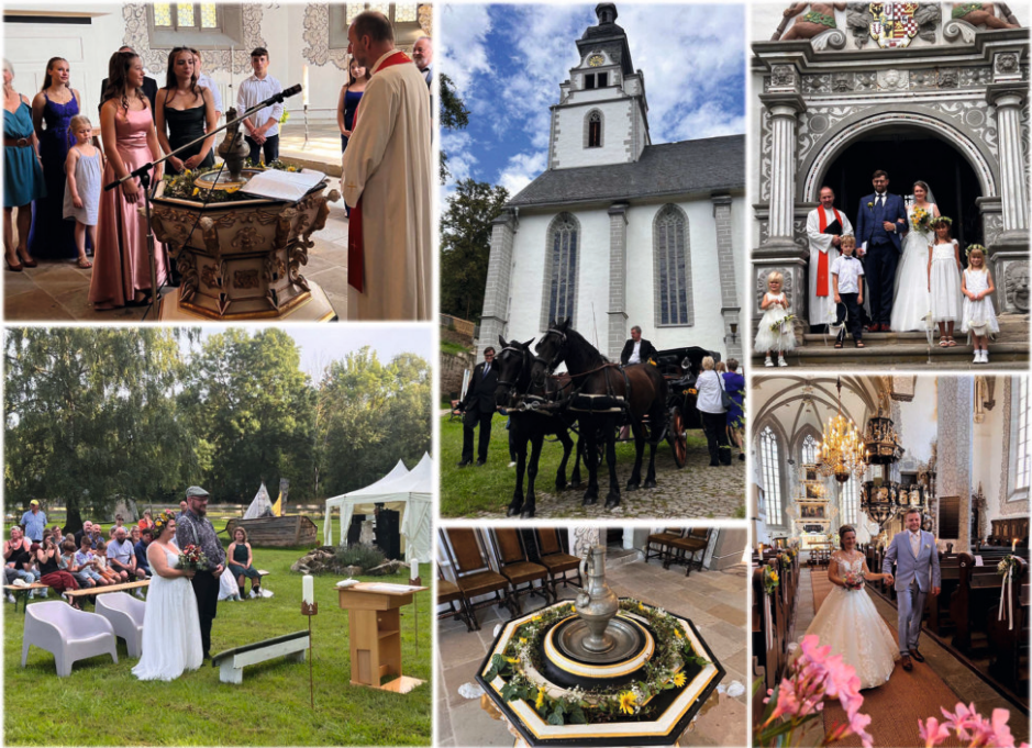
Links oben: Taufe in der Stadtkirche | Mitte oben: Hochzeitskutsche vor der Stadtkirche | Rechts: Trauungen in der Stadtkirche | Links untern: OpenAir-Trauung | Mitte unten: geschmückter Taufstein in der Stadtkirche